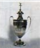
Vaso da olio santo