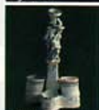
Cerere e Bacco