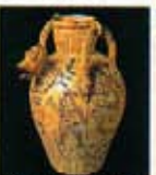
Orcio da farmacia