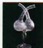
Oliera ad ampolle

Una lunga scia di storia, quella dell'olio: immerso tra gli oliveti di Imperia, per esempio, ecco il museo privato dell'Olivio dei Fratelli Carli. Dieci stanze, ricavate in una palazzina di inizio secolo, attraverso le quali i visitatori vengono accompagnati alla scoperta del mondo del frutto degli ulivi. Un percorso che arriva alle preziose collezioni di lumi e oliere, lucerne e candelabri, un patrimonio raccolto con dedizione nel corso degli anni dalla famiglia Carli. Tre sezioni sono dedicate alla tecnica olearia e alla sua evoluzione. (Info: 0183-295762, www.museo-delloilivo.com )